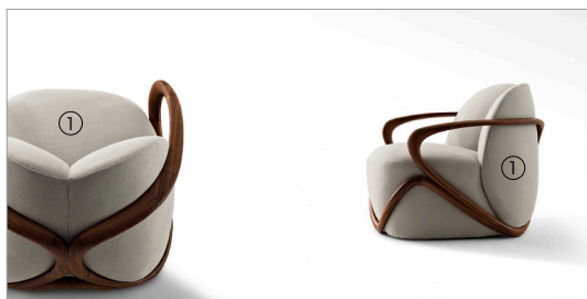
1 Hug 69800 illinois 6078 fin.11